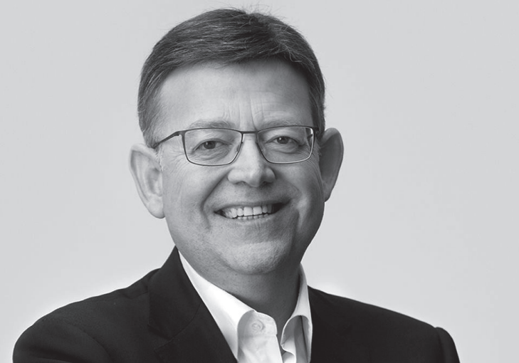
Ximo Puig va ser alcalde de Morella durant dèssset anys.