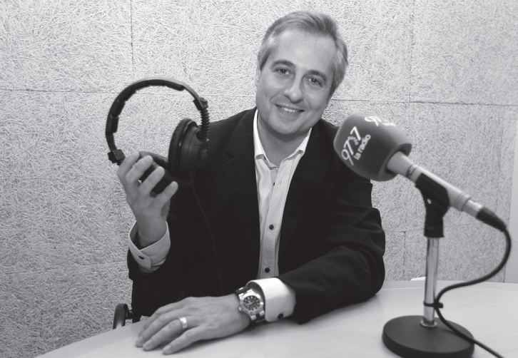
Ximo Rovira és presentador de ràdio i televisió a la 97.7 i Levante TV.