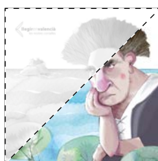
2. Un poble de llegenda Francesc Gisbert EL GEGANT DEL ROMANÍ