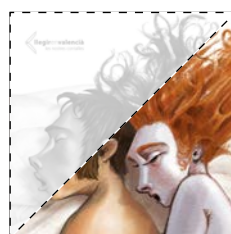
10. El Toll Blau Vicent Usó EL MISTERI DEL PALAU