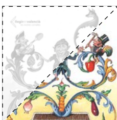
7. Revolta en l'horta Raquel Ricart ELS DONYETS