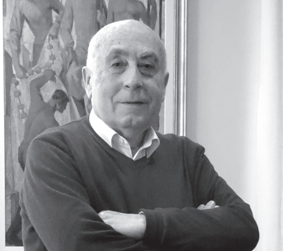
José Cholbi ocupa el càrrec de síndic de greuges des de l'any 2009.