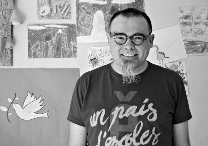
El músic de l'Alcúdia va arrancar la seua carrera artística pel 2006.