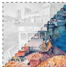
9. Després de les mareas Ivan Carbonell Iglesias EL LLAGOSTÍ