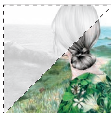
2. Ahi, bella reina... Mercè Climent LA MEL