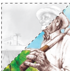
1. Micalet el Pallús Vicent Sanhermelando LA XUFA