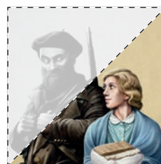
5. La dolçor del món Francesc Gisbert L'AMETLA