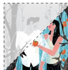
6. Un pont de plata Miguel Puig EL CAQUI