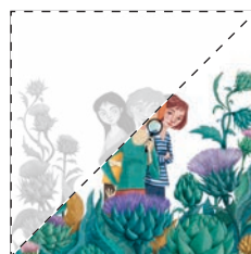
4. Les detectives i el banquet de carxofa Aina Garcia Carbó LA CARXOFA