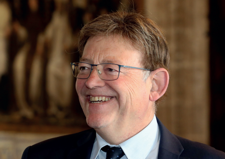
Va ser alcalde de Morella durant dèssset anys.