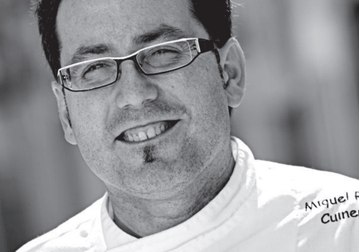
El va nàixer en un poble menut del Comtat, l'Alqueria d'Asnar.