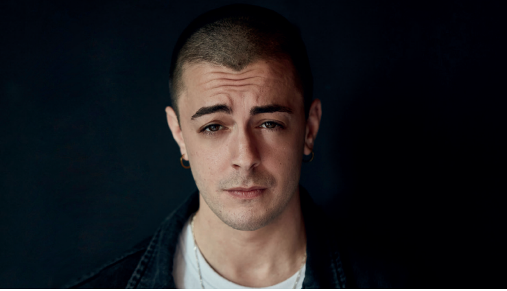
Víctor Palmero és actor principal en La que se avecina .