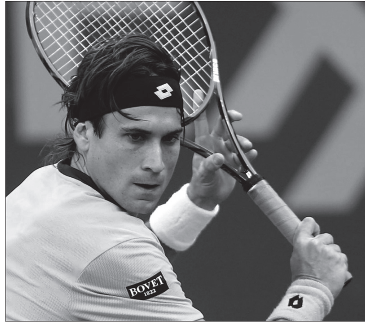
David Ferrer «Ferru» és número 7 en la classificació de l'ATP.

David Ferrer s'enfronta a situacions d'extrema pressió, reptes que desafien la fortalesa física i mental. Les lectures que acumula li han ajudat a créixer i a conèixer-se millor. I és que la perseverança i la motivació el defineixen. Recomana als més menuts, això sí, que sempre tinguen a mà els llibres: «primer que res són els estudis i llegir, després l'esport; en tot, s'ha de ser constant i responsable».