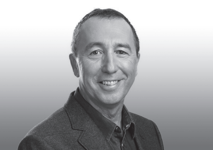
Joan Baldoví va ser alcalde de Sueca entre els anys 2007 i 2011.