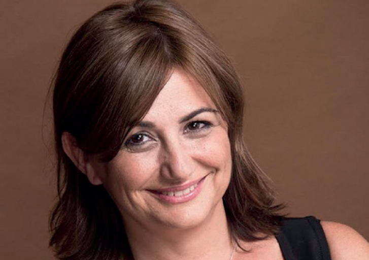
Directora General de Cultura i Patrimoni.